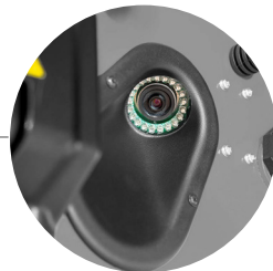
CÁMARA 3D 5MPX WIDESCOPÉ