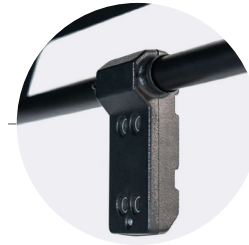
SENSOR ULTRASÓNICO DUAL