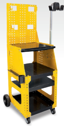
Carrito Spot 1600 ref. 051348