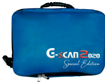
PRÁCTICO MALETÍN ACOLCHADO