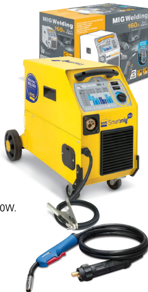
Entregado con cable de masa y antorcha Euro 2,2m.

Su ventilador con caudal constante lo protege de los sobrecalentamientos.