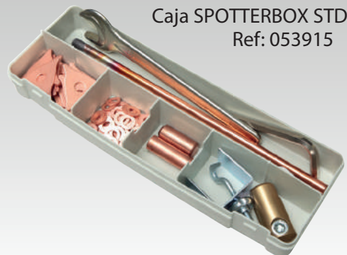
Caja SPOTTERBOX STD Ref: 053915