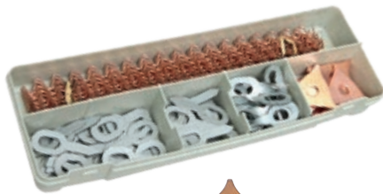
x20 ESTRELLAS TIRA CLAVOS RECUBRIMIENTO DE COBRE