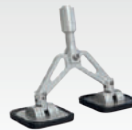
Soporte doble zapatas re. 050723