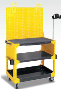
Workstation ref. 050747