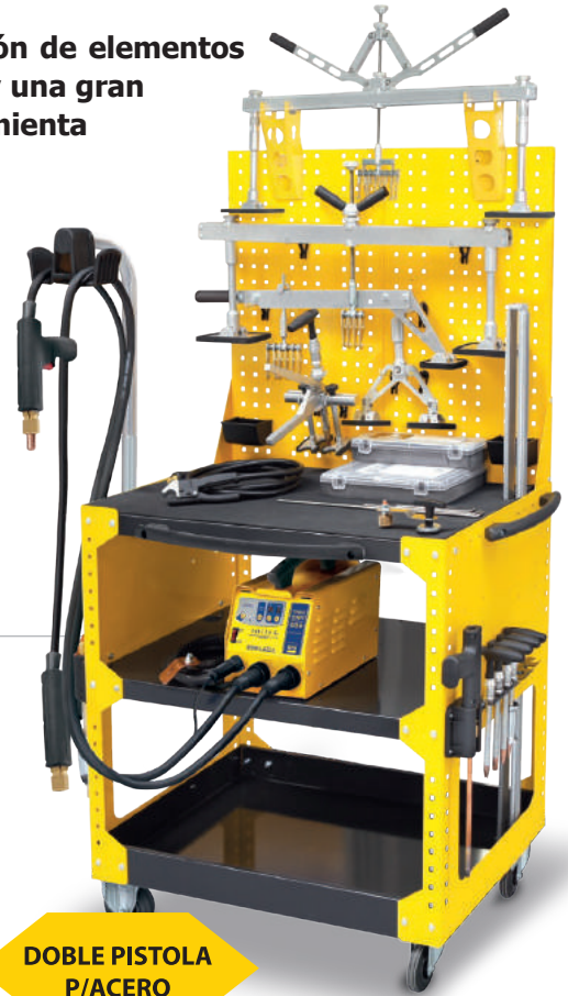
DOBLE PISTOLA P/ACERO