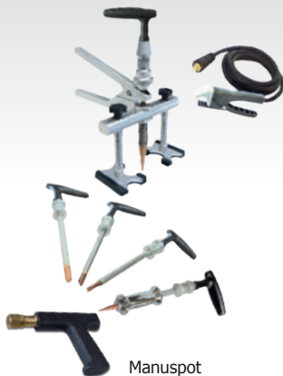
Manuspot ref. 050679