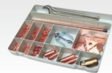
CAJA spotterBOX PRO re. 050075