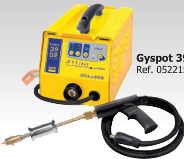
Gyspot 3902 Ref. 052215