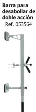
Barra para desabollar de doble acción Ref. 053564