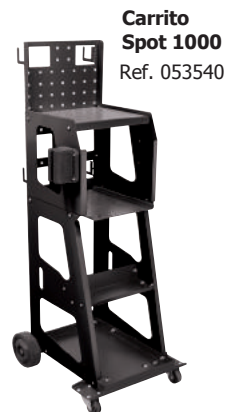
Carrito Spot 1000 Ref. 053540